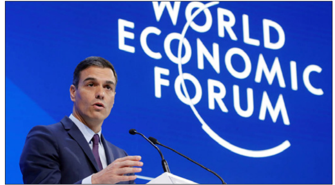
El presidente de Gobierno, D. Pedro Sánchez, durante una sesión plenaria celebrada en el ámbito del Foro Económico Mundial 2019 en Davos (Suiza) el 23 de enero de 2019.

24-10-2017, asistencia de SM la Reina Letizia a la reunión en la sede de la Organización Mundial de la Salud en Ginebra.