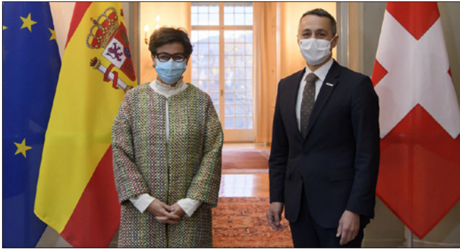
La ministra de Asuntos Exteriores, Unión Europea y Cooperación es recibida en la Maison de Watteville por el consejero Federal Ignazio Cassis .- Berna, 20 de noviembre de 2020.